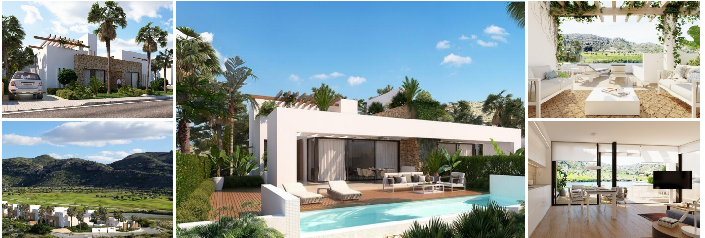
REKKEHUS MED HAGE, SVØMMEBASSENG OG PRIVAT SOLARIUM I FONT DEL LLOP GOLFBANE

Rekkehus med privat hage, svømmebasseng og solarium, utendørs parkeringsplass og store felles grøntarealer.