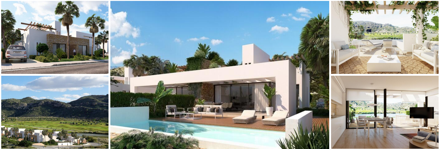
REKKEHUS MED HAGE, SVØMMEBASSENG OG PRIVAT SOLARIUM I FONT DEL LLOP GOLFBANE

Rekkehus med privat hage, svømmebasseng og solarium, utendørs parkeringsplass og store felles grøntarealer.