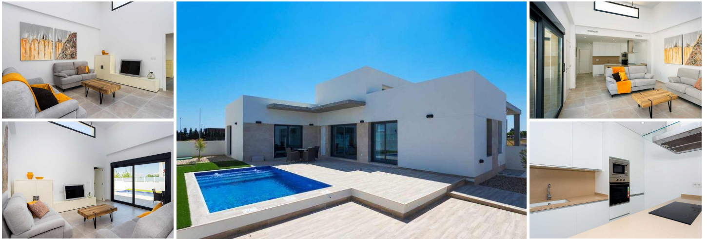
MIDDELHAV DESIGN VILLA NÆR ALT

Villa med 3 soverom med innebygde garderober og 2 bad og med 18 m2 terrasse. Spisestuen har direkte tilgang til det private bassenget og uteområdene.