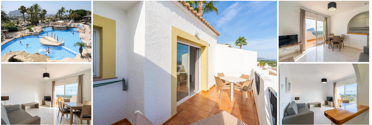
TOP ETASJE BUNGALOW LEILIGHETER I CALPE

Vakre bungalowleiligheter i toppetasjen med 1 soverom, 1 bad, åpen kjøkkenløsning med stue, garderober og terrasser.