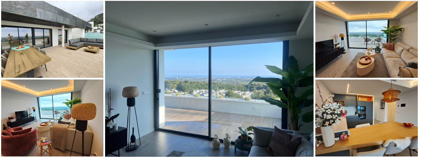
Panoramische perfectie bij Golf Suites La Sella

Stel je voor dat je wakker wordt met de mediterrane zon die door de kamerhoge ramen naar binnen schijnt, met het weelderige groen van de prachtige omgeving vlakbij een golfbaan van wereldklasse en de sprankelende blauwe zee als dagelijks decor. Dit prachtige appartement met drie slaapkamers, gelegen in het prestigieuze Golf Suites La Sella , biedt een bevoorrechte plek om te genieten van het beste van de Costa Blanca-levensstijl, op slechts 20 minuten van de levendige kustplaatsen Denia en Jávea.