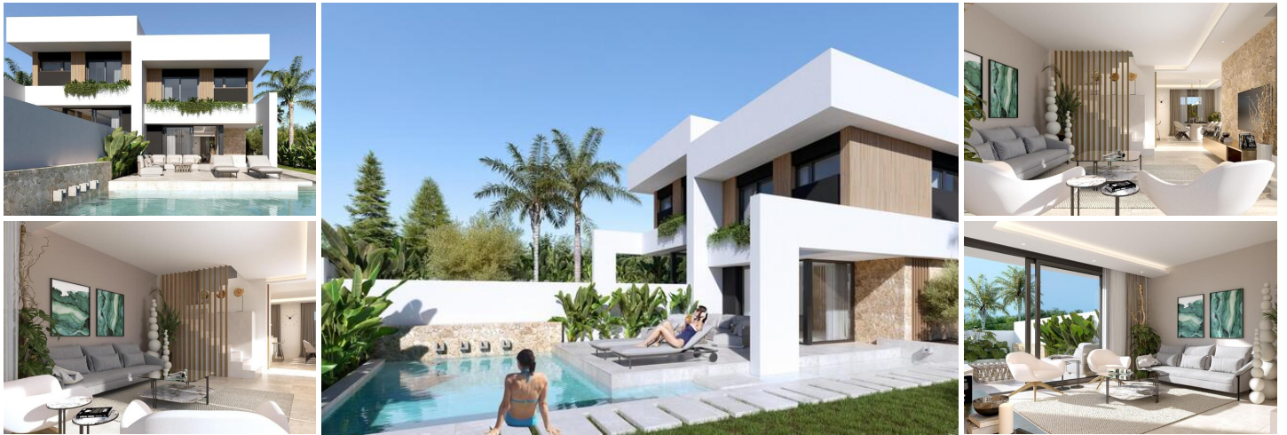
Moderne halfvrijstaande villa's met privézwembad in Las Filipinas-Orihuela Costa

Exclusieve nieuwbouwwilla's op een toplocatie aan de Costa Blanca