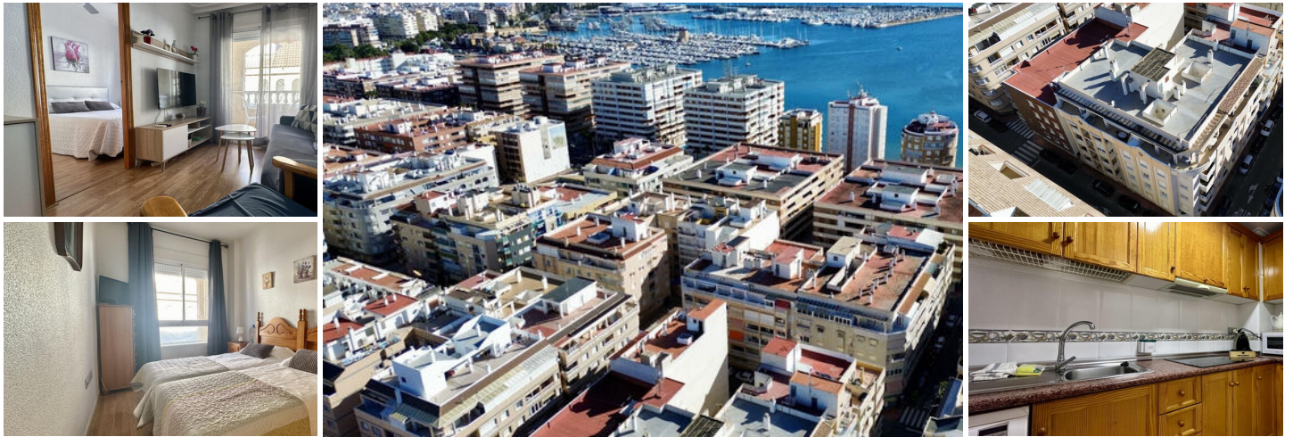
Overzicht van de woning

Licht appartement gelegen op de 4e verdieping van het bekende gebouw Residencial Acequión in Torrevieja, met gevels aan Calle Beniaján en Calle Rafal. Een praktische woning in een gevestigde buurt van de stad, ideaal als vakantieverblijf, permanente woning of investeringsobject voor verhuur.