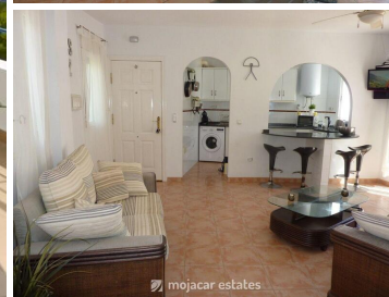
La Casa Redonda

Uniek cirkelvormig penthouse met 3 slaapkamers met een spectaculair uitzicht op de bergen en de zee in gemeenschap met zwembad op ongeveer 400 meter van het strand en alle voorzieningen in Playa de las Ventanicas in Mojácar.