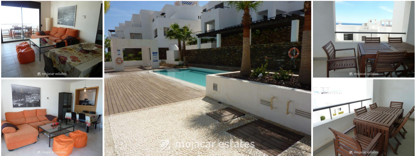
Casa El Marques

Mooi appartement voor 6 personen in een urbanisatie gelegen aan de rand van Mojácar met gemeenschappelijke zwembaden en Macenas strand ligt tegenover de urbanisatie.