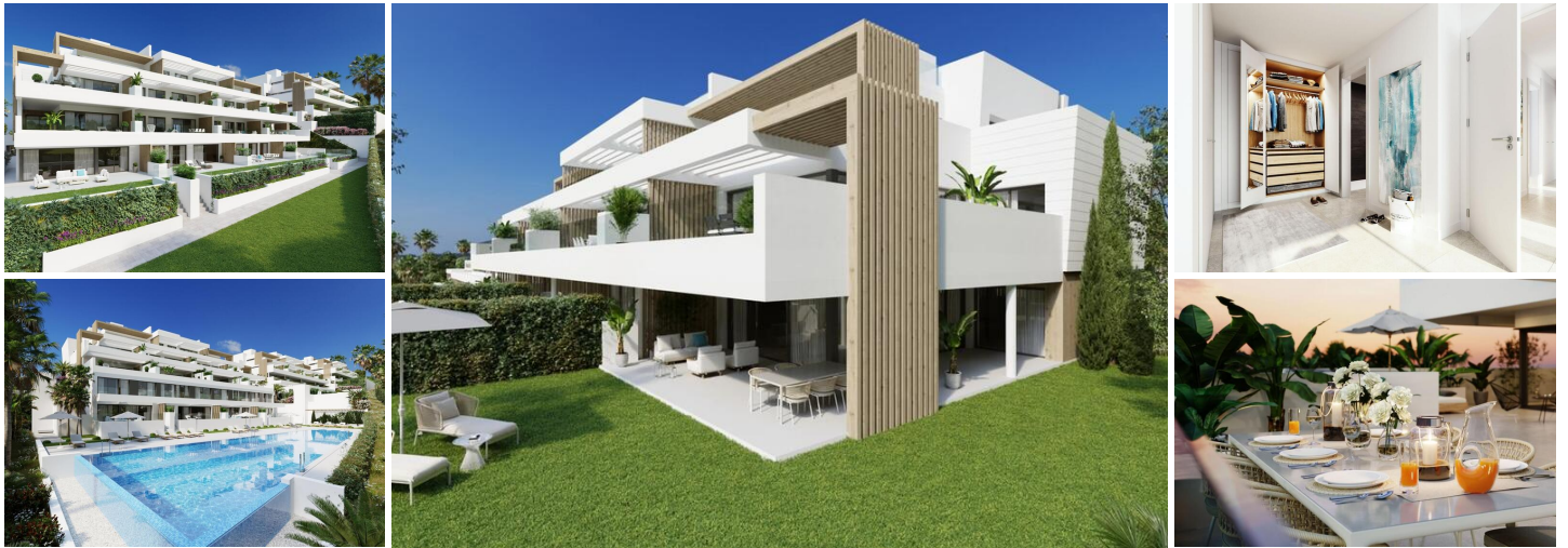
2 Slaapkamer appartement in het Las Mesas gebied van Estepona

LIF3 is een nieuw in aanbouw zijnde ontwikkeling waar modern wonen samengaat met uitzonderlijk comfort! Deze exclusieve woonomgeving biedt 40 doordacht ontworpen woningen met 2 en 3 slaapkamers, elk voorzien van ruime terrassen. Kies uit begane grond appartementen met royale tuinen of duplex penthouses met dromerige terrassen voor unieke en bijzondere momenten met uw dierbaren.