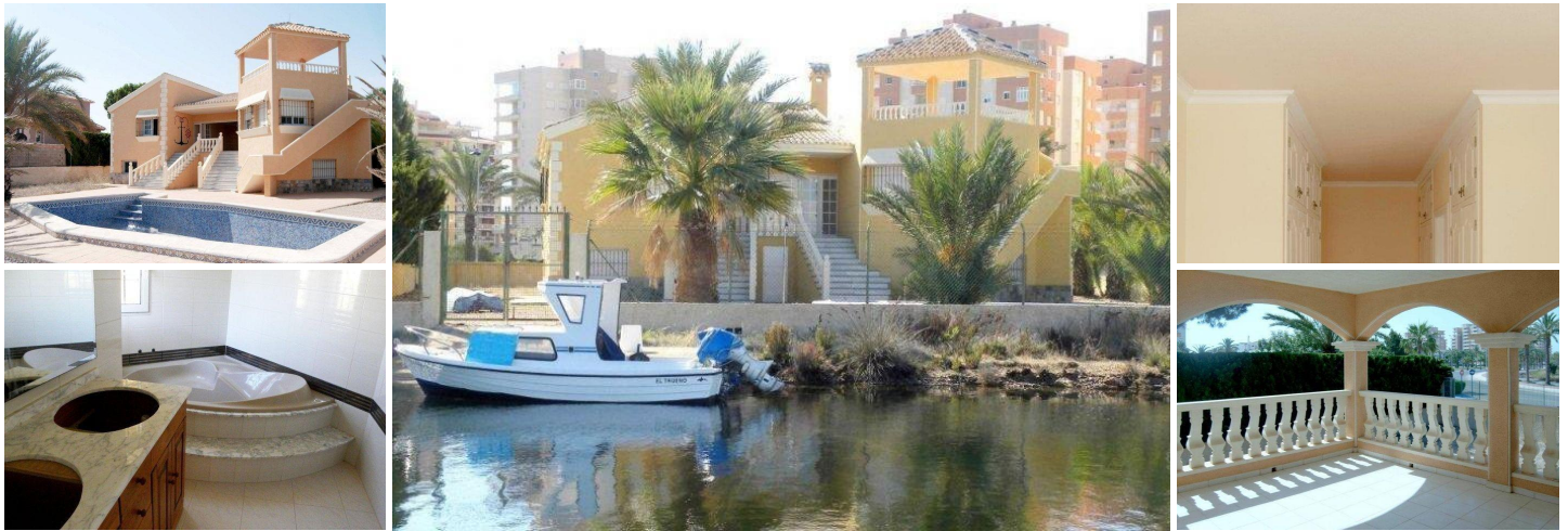
LUXE VILLA MET PRIVÉ PIER

Tussen twee zeeën, de Mar Menor en de Middellandse Zee, ligt deze prachtige luxe villa op het schiereiland La Manga (Murcia), met een van de meest bevoorrechte uitzichten in de omgeving (en op een paar meter van het strand). eigen aanlegsteiger (voor een boot tot 12 m) die toegang geeft tot de zee via een systeem van brede kanalen.