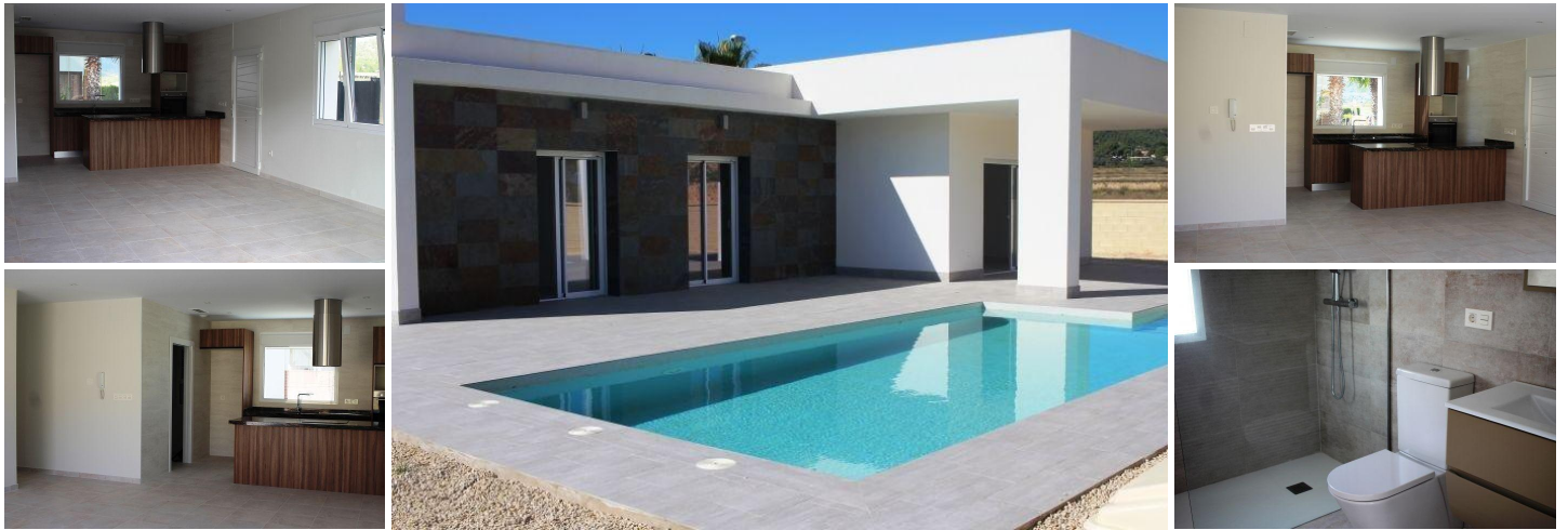
VILLA TUSSEN ZEE EN BERGEN

Fantastische nieuw gebouwde villa op een perceel van 500m 2 in La Romana.