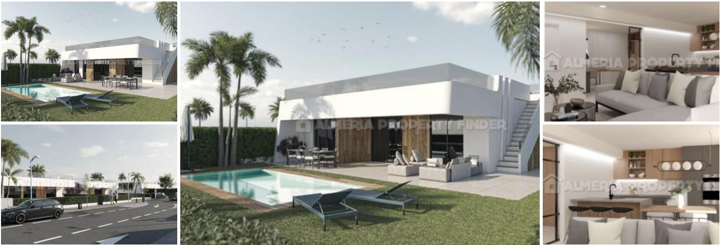
Alhama Nature Resort - Atenea II - Villa nr. 1

Luxe villa met 92,91 m 2 bebouwde oppervlakte, 362,21 m 2 perceeloppervlakte, 11,20 m 2 terras, 250,85 m 2 tuin, 94,20 m 2 solarium, woonkamer, keuken, 3 slaapkamers, 2 badkamers met douche, 2 toiletten, pre-installatie van airconditioning, zwembad, parkeerplaats