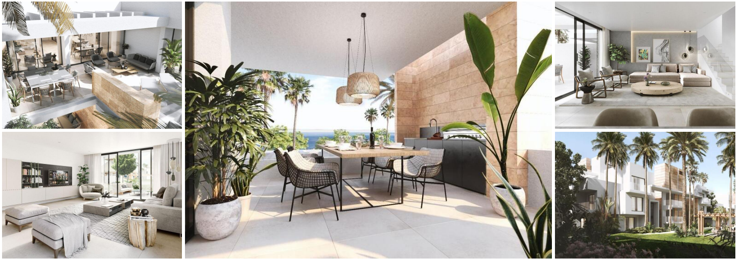
Ático de 3 dormitorios en en New Golden Mile

Descubre una exclusiva comunidad tropical compuesta por 140 residencias y áticos, que redefinen el concepto de lujo en Estepona. Este proyecto cuenta con una arquitectura icónica creada por el galardonado estudio Villarroel Torrico. Las amplias viviendas ofrecen interiores espaciosos, terrazas privadas y solárium en la azotea, brindando un estilo de vida sofisticado y relajado.