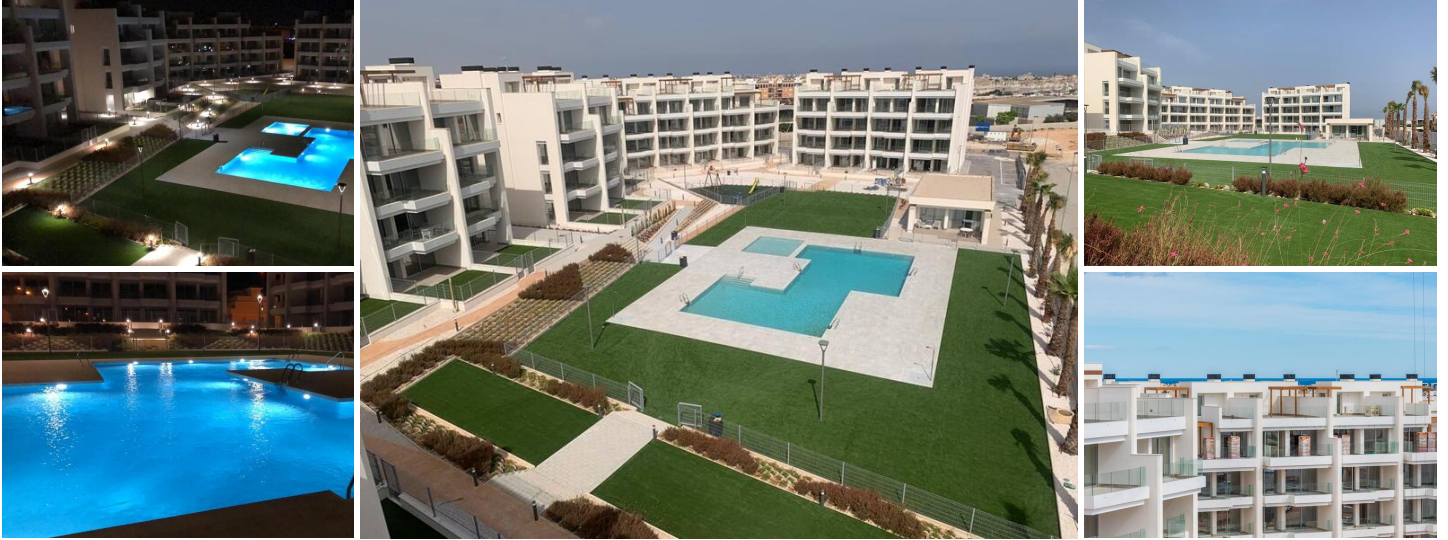
NIEUWBOUW WOONCOMPLEX IN VILLAMARTIN

Nieuwbouw wooncomplex met in totaal 94 moderne 2 slaapkamer appartementen en penthouses in Villamartin.