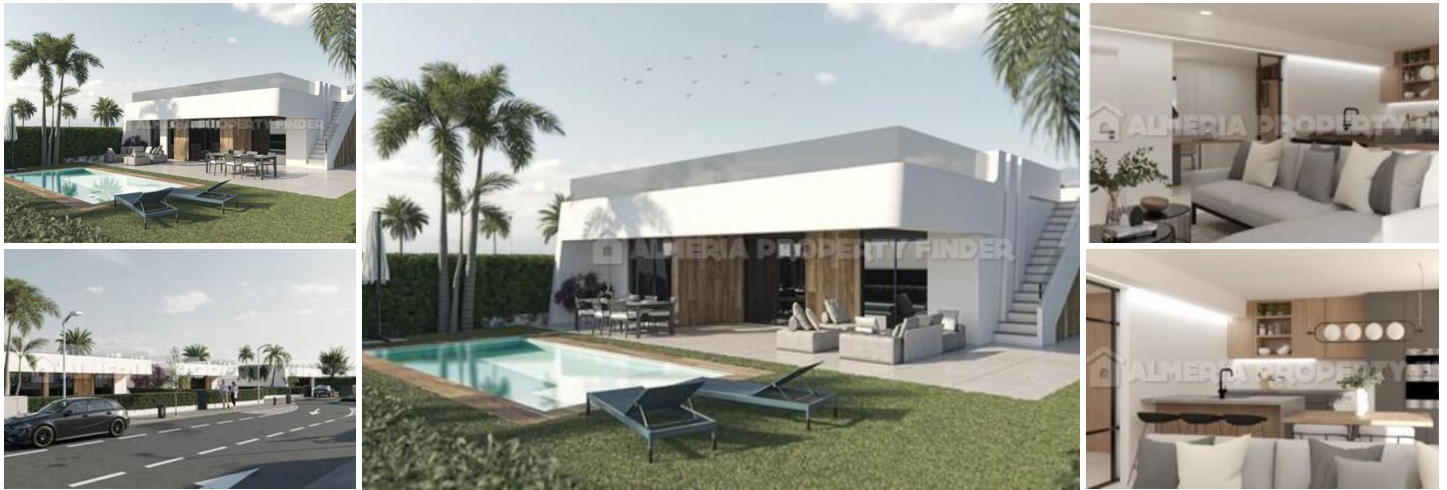
Alhama Nature Resort - Atenea II - Villa nr. 2

Luxe villa met 92,91 m 2 bebouwde oppervlakte, 259,10 m 2 perceeloppervlakte, 11,20 m 2 terras, 147,75 m 2 tuin, 94,20 m 2 solarium, woonkamer, keuken, 3 slaapkamers, 2 badkamers met douche, 2 toiletten, pre -installatie van airconditioning, zwembad, parkeerplaats