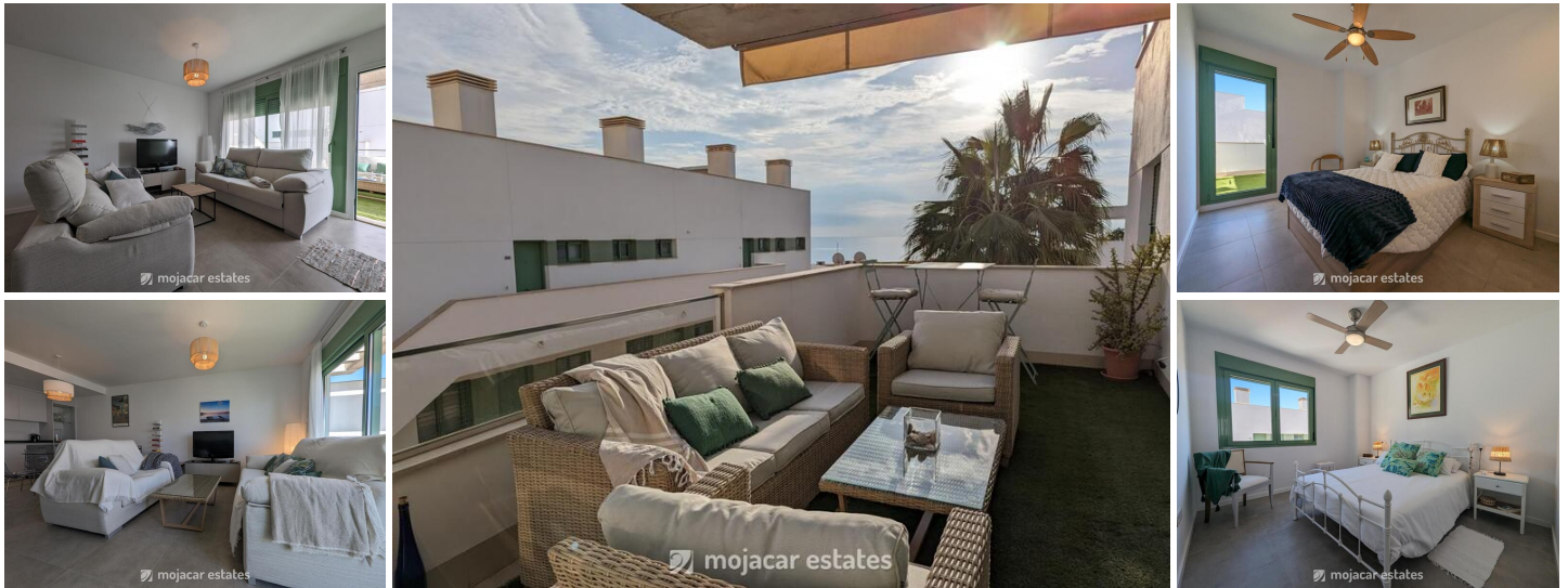
Cantal Homes Bal

Ontdek modern comfort in dit prachtige appartement op de eerste verdieping, genesteld in het nieuwste complex in Mojacar Playa – Cantal Homes. Deze moderne residentie is perfect gelegen aan de zuidkant van Mojacar en biedt een rustig toevluchtsoord voor maximaal 4 personen met 2 slaapkamers en 2 badkamers. Het ligt op een uitstekende locatie aan de frontlinie en kijkt uit over het beroemde strand Las Ventanicas.