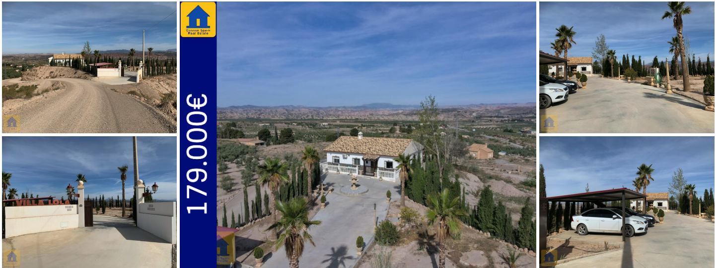
Villa Lola in Freila

Dit prachtige pand ligt op een heuveltop, omringd door 360 ° glooiende heuvels en bergen, met uitzicht op het meer Negratin in de verte. Deze heuvels maken deel uit van de natuurlijke Badlands die kenmerkend zijn voor deze regio. Het pand voelt afgelegen aan, maar het is slechts een paar minuten rijden naar de snelweg en 5 minuten rijden naar het traditionele Andalusische dorp Freila. Het huis, terras en tuin zijn volledig omheind met een privacypoort. Een brede oprit leidt naar de patio, de tuinen, de carport voor 2 auto's en het huis. Langs de voorzijde van het huis loopt een veranda. Aan de achterkant is een overdekt terras.