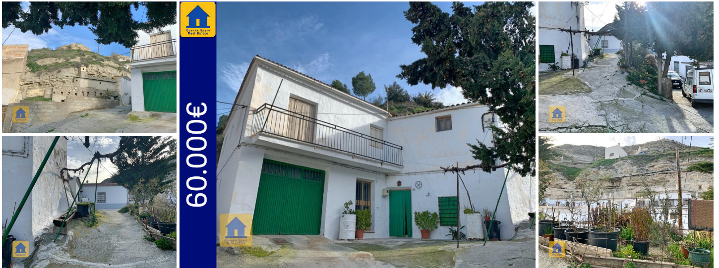
Galera grotwoning amansio

Mooi groot herenhuis + grot (ongeveer 60% huis / 40% grot) gelegen op 5 minuten lopen van het centrum van Galera. De ruime patio heeft een dennenboom en biedt uitzicht op de berg La Sagra. Het huisgedeelte is gerenoveerd in een traditionele Spaanse stijl met veel originele karakterdetails. Het grotgedeelte moet worden gerenoveerd (één kamer is gerenoveerd tot een basisniveau).