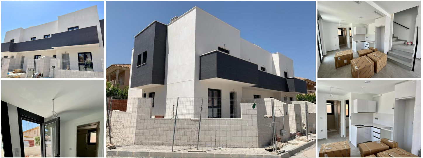
NIEUWBOUW HALFVRIJSTAANDE VILLA'S IN SANTIAGO DE LA RIBERA

Nieuwbouw luxe complex van 3 geschakelde villa's in Santiago de la Ribera.