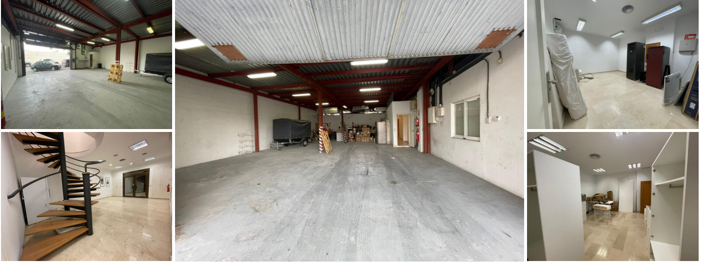
Magazijn, Marbella, Costa del Sol.

Ligging: Strand, Stad, Commercieel gebied, Strand, Dicht bij golfbaan, Dicht bij haven, Dicht bij winkels, Dicht bij zee, Dicht bij scholen, Dicht bij jachthaven.