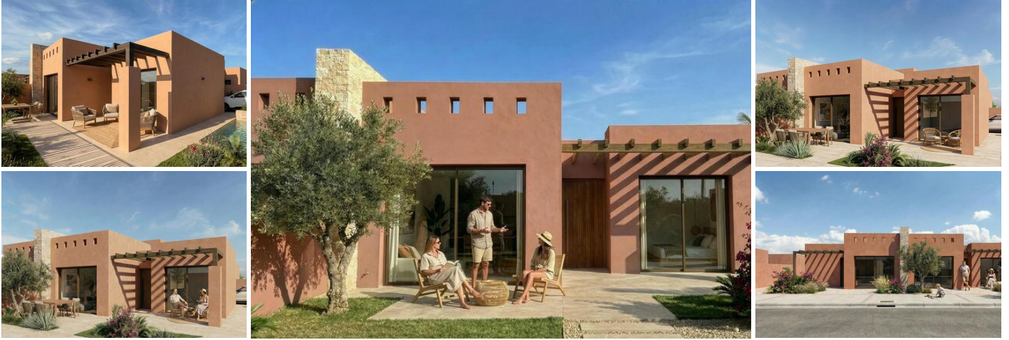
Villas neuves à El Alba Mediterranean Resort, à Torre Pacheco

Un cadre de vie moderne dans une destination touristique en plein essor