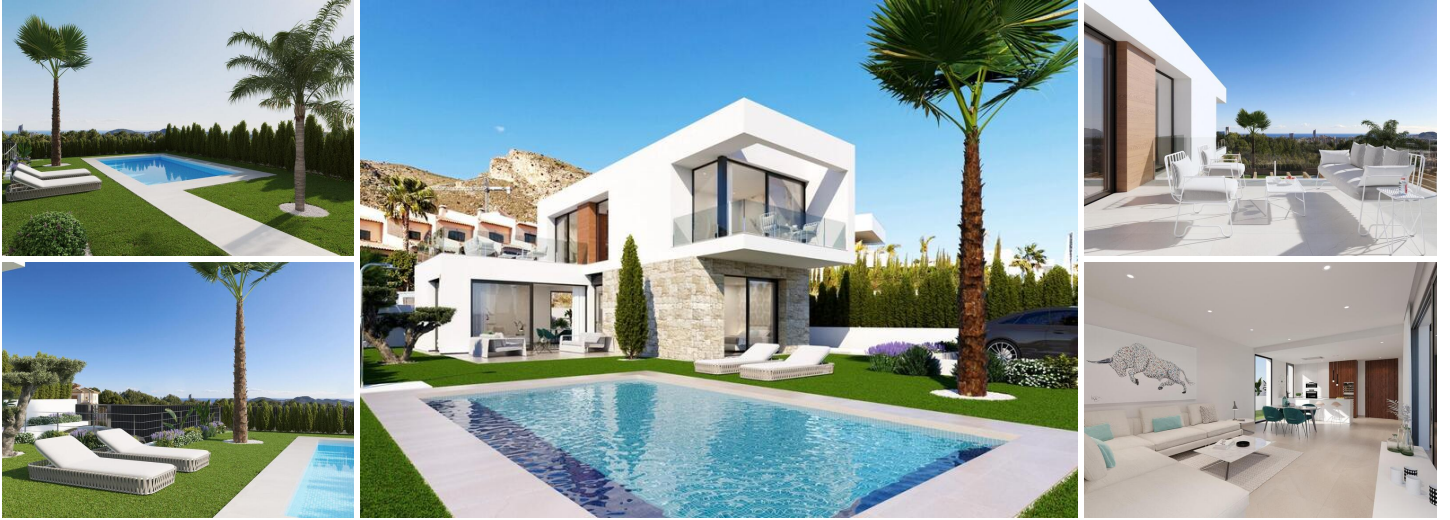
Luxueuses villas neuves à Sierra Cortina, Finestrat

Découvrez l'élégant nouveau développement de villas indépendantes dans le quartier exclusif de Sierra Cortina, à Finestrat. Nichées dans une zone pittoresque proche de Benidorm, ces propriétés haut de gamme offrent des espaces de vie modernes et des équipements de premier ordre. Avec un accès facile à la côte méditerranéenne, ces villas sont idéales pour tous ceux qui recherchent un mélange de luxe, de confort et de commodité. À seulement 5 km du centre-ville animé de Benidorm, ce projet vous place également à une courte distance des principaux points d'intérêt.