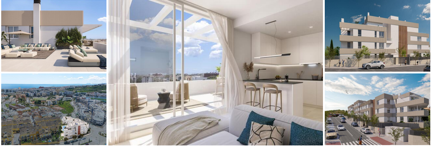
Penthouse de 2 Chambres avec Vues Panoramiques et Grande Terrasse

Ce nouveau programme en vente sur plan, situé en plein cœur d'Estepona, offre un style de vie contemporain et sophistiqué dans l'une des villes les plus dynamiques de la Costa del Sol. Avec son architecture moderne remarquable et ses finitions haut de gamme, le projet allie élégamment design, confort et praticité.