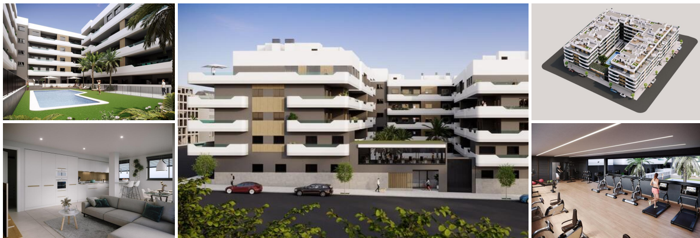
Nouveau complexe résidentiel a santa pola

nouveau complexe résidentiel moderne fermé comprenant des appartements et des penthouses de 1, 2 et 3 chambres à coucher avec 2 salles de bains complètes. Le complexe se compose de 4 escaliers d'appartements avec de vastes espaces communs paysagers, y compris une piscine, un espace de détente et un gymnase.