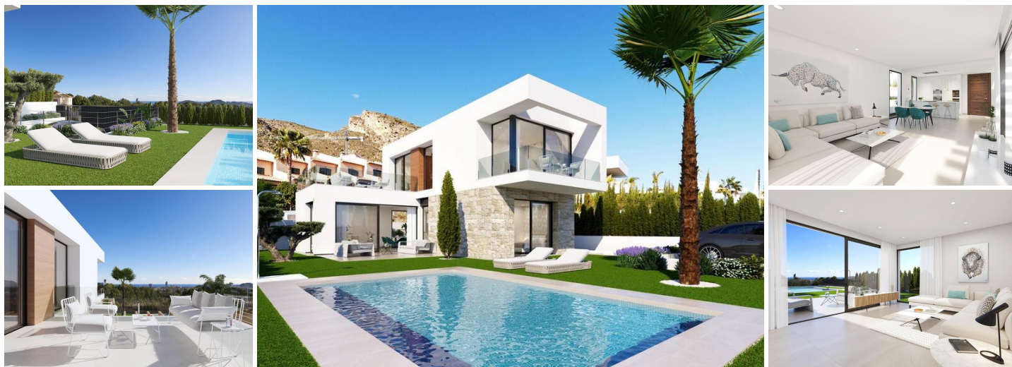
Luxeuses villas neuves à Sierra Cortina, Finestrat

Découvrez l'élégant nouveau développement de villas indépendantes dans le quartier exclusif de Sierra Cortina, à Finestrat. Nichées dans une zone pittoresque proche de Benidorm, ces propriétés haut de gamme offrent des espaces de vie modernes et des équipements de premier ordre. Avec un accès facile à la côte méditerranéenne, ces villas sont idéales pour tous ceux qui recherchent un mélange de luxe, de confort et de commodité. À seulement 5 km du centre-ville animé de Benidorm, ce projet vous place également à une courte distance des principaux points d'intérêt.