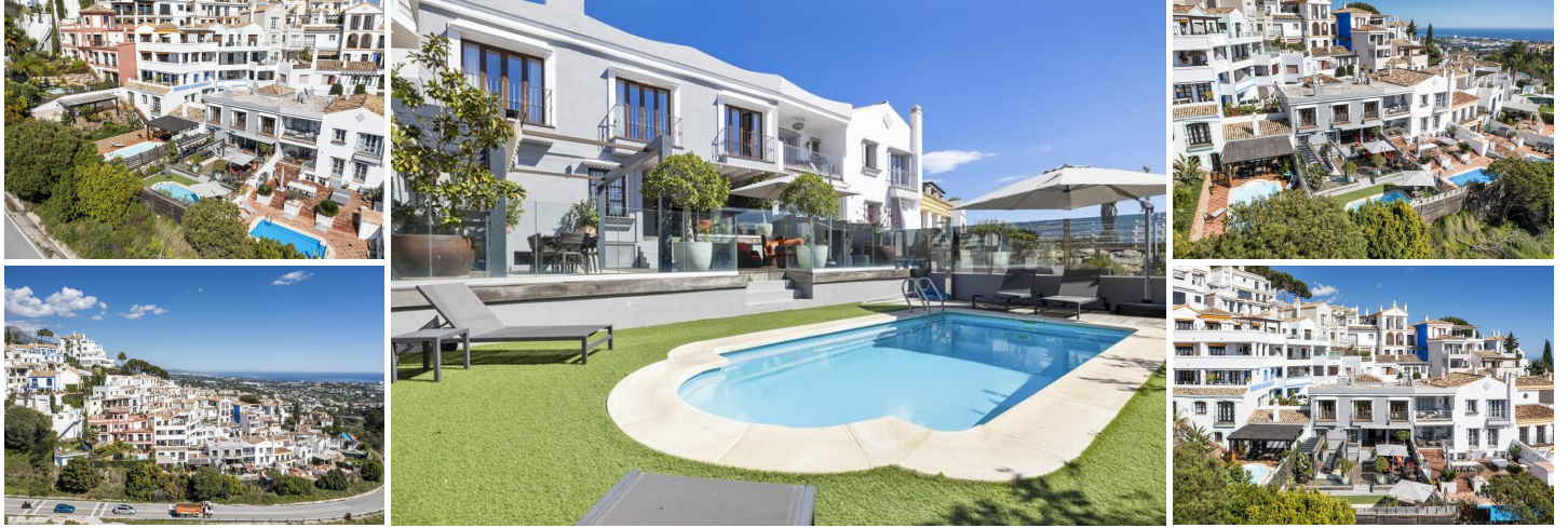
Exquise Maison de Ville de 5 Chambres à La Heredia, Benahavís – 1 095 000 €

Située dans une urbanisation exclusive de Benahavís, cette luxueuse maison de ville de 5 chambres et 4,5 salles de bains offre une expérience de vie idyllique sur la Costa del Sol. Avec une généreuse superficie construite de 333 m 2 et un terrain de 179 m 2 , cette élégante maison offre amplement d'espace pour se détendre et recevoir. La propriété a été soigneusement conçue avec des finitions haut de gamme et des commodités modernes, incluant des appareils électroménagers de premier choix de Liebherr et Bosch.