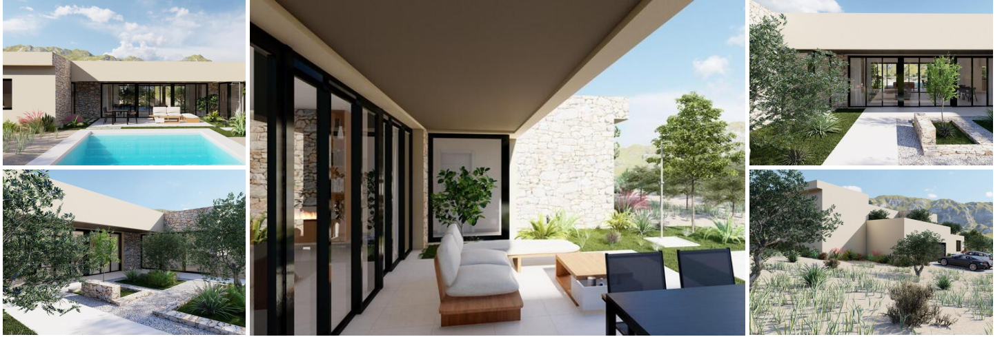
VILLA NEUVE À YECLA, MURCIE

Nouvelle construction d'une villa de luxe exclusive située dans un magnifique vignoble à Yecla, Murcie.