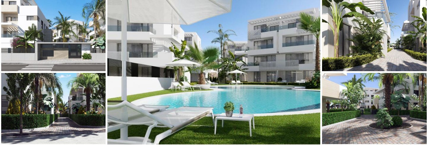
APPARTEMENTS NEUFS DANS UN COMPLEXE PRIVÉ FERMÉ DANS LA PROVINCE DE MURCIE

Complexe résidentiel neuf de 6 blocs, soit un total de 42 appartements.