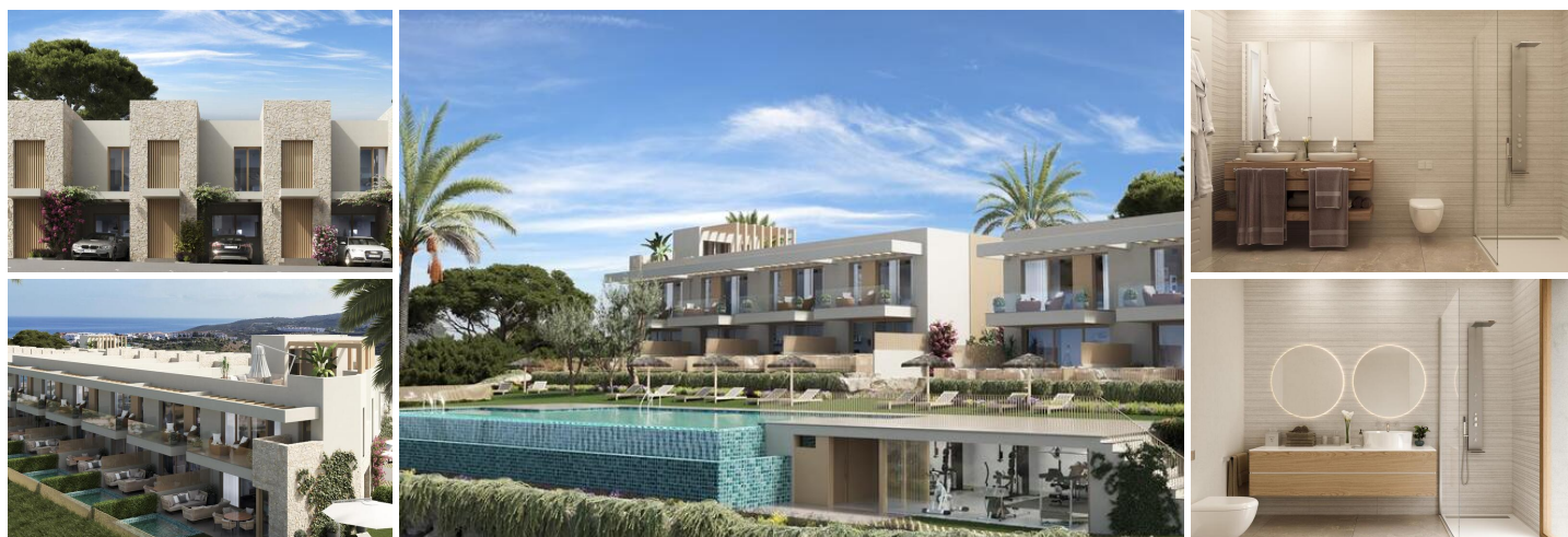
Maisons Mitoyennes Nouvelles avec Vue sur Mer à Vendre à Manilva

Entre Estepona et Sotogrande, dans la zone en plein essor de Manilva, ce nouveau projet en cours de commercialisation propose 20 maisons mitoyennes contemporaines, pensées pour une vie moderne et élégante, avec des vues spectaculaires sur la Méditerranée et la campagne environnante. La livraison est prévue pour le quatrième trimestre 2027, une belle opportunité pour les acheteurs précoces.