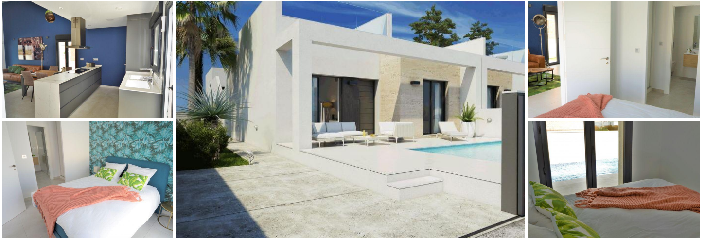
VILLA, GOLF ET CTE

Maison composée de 2 chambres et 2 salles de bain, avec piscine privée et solarium. Le salon offre un accès direct à la piscine et à la terrasse.