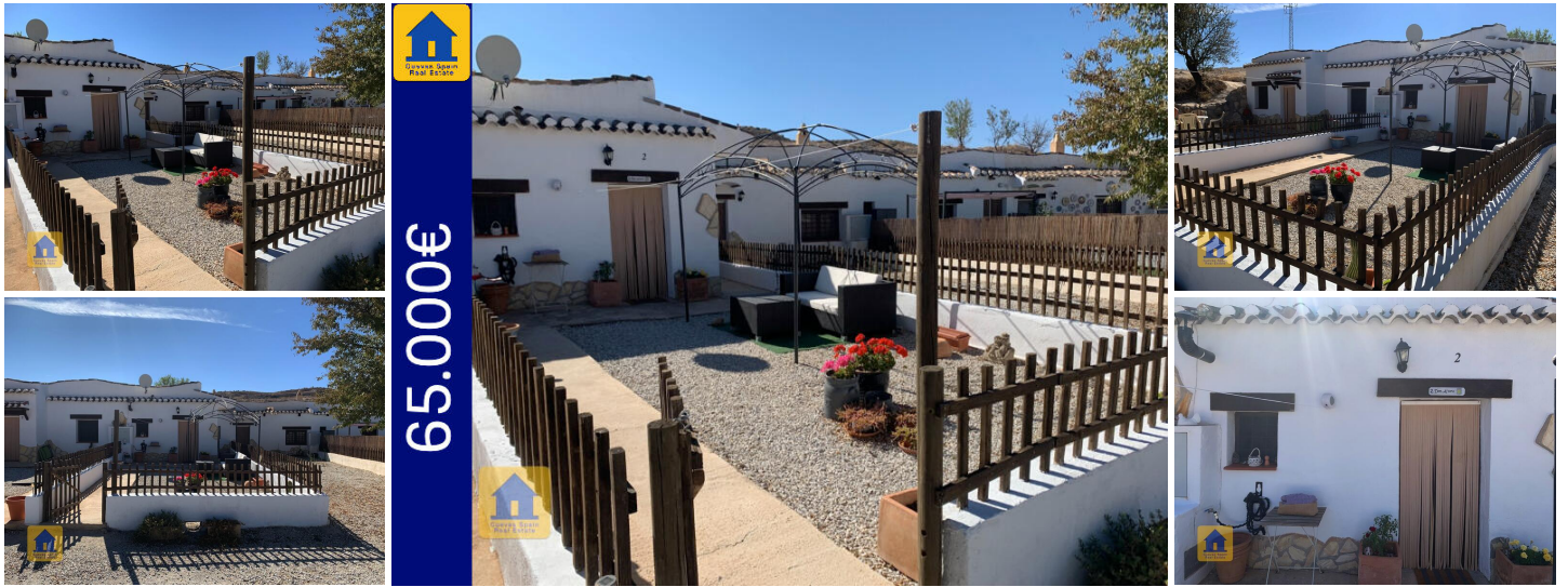
Cueva Don Alvaro 2 à Orce

Cette propriété fait partie d'un complexe unique de 20 maisons troglodytes situées en hauteur et offrant une vue imprenable sur les montagnes de la Sierra de Cazorla. L'endroit offre de belles vues paisibles et des promenades dans la nature.