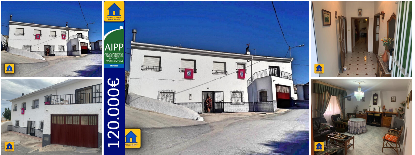
Castillejar maison troglodyte marcelino

Grande maison troglodyte dans le joli village de Castillejar. C'est une maison à deux étages avec une vaste grotte à l'arrière. Il y a 6 chambres et 2 salles de bains et la propriété est vendue joliment meublée. La propriété entière est dans un état impeccable et prête à être habitée. La partie maison dispose d'un garage qui est actuellement utilisé comme une buanderie. Il y a une possibilité d'acquérir un autre garage juste en face de la rue. La partie grotte est vaste, profonde et de grande qualité. La partie maison a une terrasse accessible depuis le premier étage avec une vue magnifique vers l'est sur les Badlands. Il y a une entrée latérale séparée menant au deuxième étage qui peut être pratique si vous souhaitez utiliser le deuxième étage comme location de vacances ou location à long terme. Accès facile, places de parking. La propriété est située près du centre du village et toutes les commodités sont à moins de 10 minutes à pied.