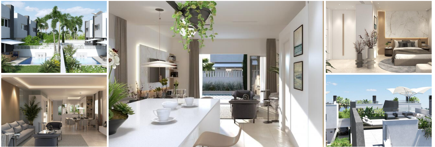
Res Natura III - Villas de luxe à Pilar de la Horadada

Une nouvelle promotion de 6 villas de luxe indépendantes avec piscine privée et parking sur le terrain est à vendre.