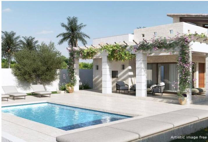
Artistic image free of contractual nature