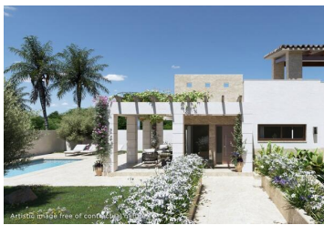
Artistic image free of contractual nature