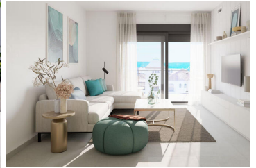
COSTA GALERA CULMIA

Disfruta de tu nuevo hogar junto al mar en una de las mejores zonas de la Costa Tropical.