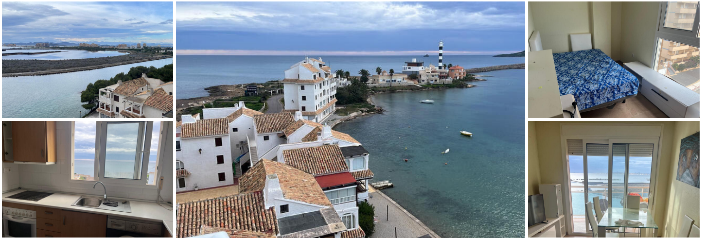
Apartamento en Venta – La Manga del Mar Menor (Murcia)

Situado en el consolidado Edificio Paraíso del Sol, este luminoso apartamento en sexta planta ofrece una excelente oportunidad para adquirir una vivienda vacacional o de inversión en una de las zonas más demandadas de La Manga, a pocos minutos a pie del paseo marítimo del Mar Menor.