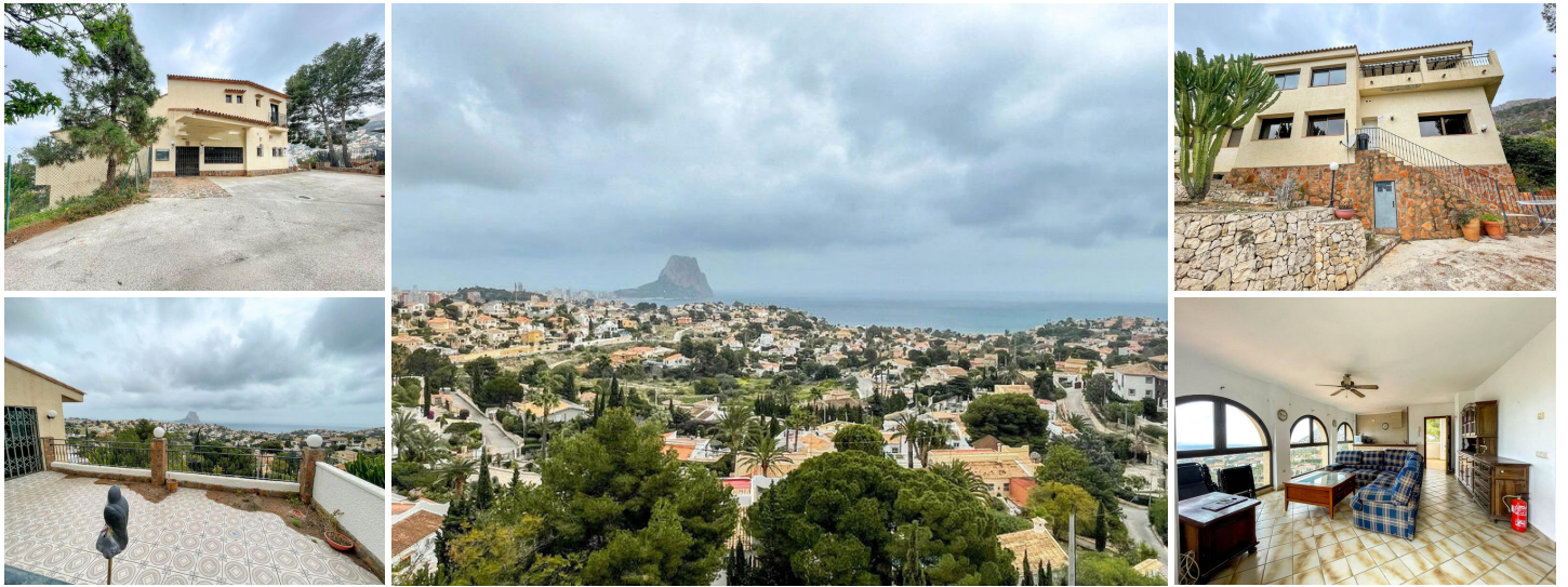
Inversores Villa con Local / Restaurante con vistas al mar a la venta en Calpe - Inversores

Ubicada en una parcela excepcional de 2.800 m 2 con orientación sur, esta propiedad ofrece impresionantes vistas despejadas al mar Mediterráneo y al Peñón de Ifach. Su ubicación privilegiada, a la entrada de Calp, garantiza un acceso cómodo y una excelente conectividad, lo que la convierte en una oportunidad única tanto para uso residencial como comercial.