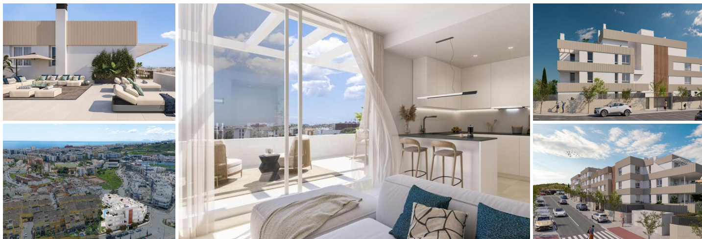
Ático de 2 Dormitorios con Vistas Panorámicas y Amplia Terraza

Este nuevo desarrollo sobre plano en el corazón de Estepona ofrece un estilo de vida contemporáneo y sofisticado en una de las localidades más vibrantes de la Costa del Sol. Con una arquitectura moderna y acabados de alta calidad, el proyecto combina a la perfección estilo, confort y funcionalidad.