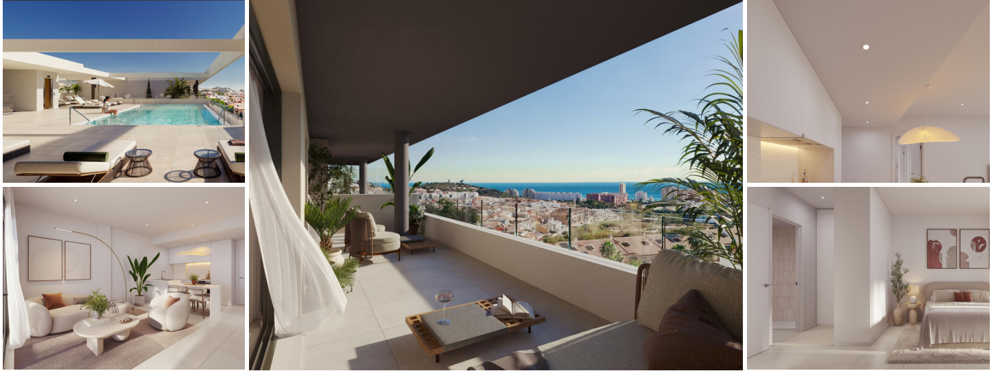
Apartamento de 3 dormitorios con vistas al mar en Fuengirola

Situado en el corazón de la Costa del Sol, en Fuengirola, este exclusivo apartamento de 3 dormitorios ofrece la mezcla perfecta de diseño, comodidad y estilo de vida mediterráneo. Brillante y espacioso, cuenta con áreas de vida cuidadosamente diseñadas que maximizan la luz natural y proporcionan un flujo sin costuras entre el salón, la cocina moderna y dos acogedores dormitorios — ideal para la relajación y la vida cotidiana.