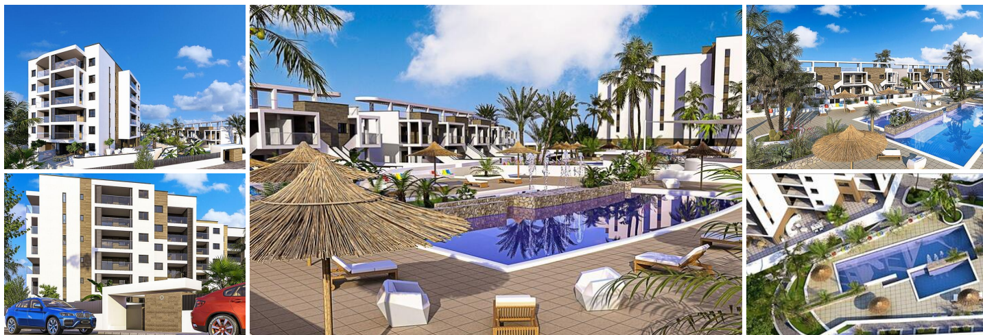
Apartamentos y Bungalows de Obra Nueva en Mil Palmeras

Moderno complejo residencial en una ubicación privilegiada