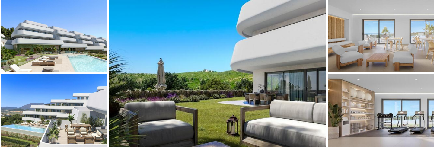
Planta baja de 3 dormitorios con jardín

Este nuevo proyecto de obra nueva se ubica en una parcela elevada y bañada por el sol, con impresionantes vistas al Mediterráneo y al campo de golf de Casares. Consta de 49 apartamentos de dos y tres dormitorios en un exclusivo complejo de estilo boutique. Cada vivienda ha sido diseñada para maximizar la luz natural y disfrutar del entorno, desde plantas bajas con jardines elevados hasta áticos con terrazas panorámicas.