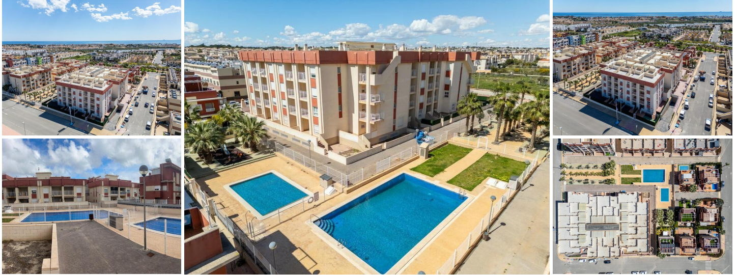
Complejo Residencial Regenerado en Lomas de Cabo Roig - Apartamentos Reformados