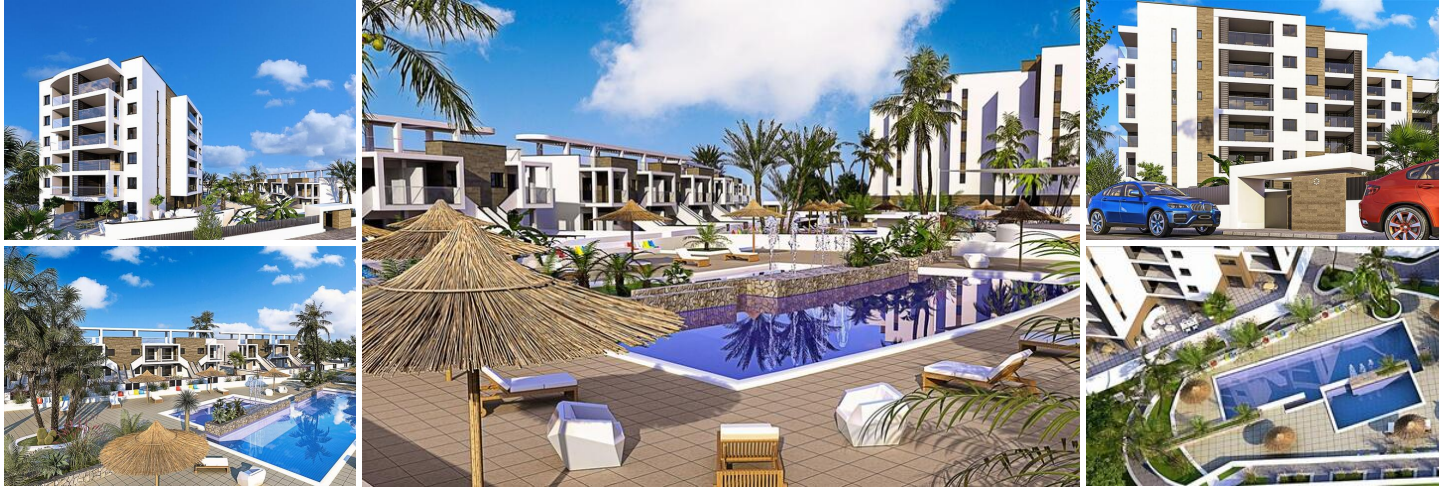
Apartamentos y Bungalows de Obra Nueva en Mil Palmeras

Moderno complejo residencial en una ubicación privilegiada