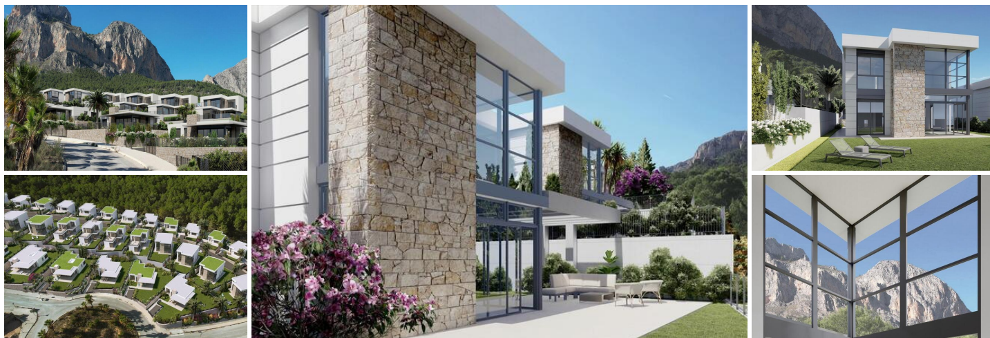
Chalets de Nueva Construcción en Polop, Alicante