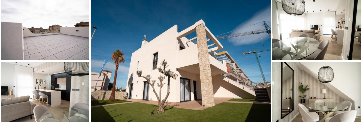
Bungalows de obra nueva en Pilar de la Horadada