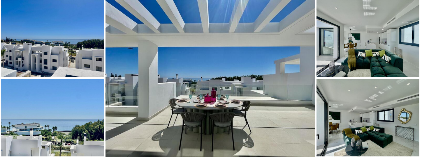
Ático 3D en venta en Guadalobón, Málaga.

Ático Moderno con Terrazas y Solárium con Vistas al Mar (3 dormitorios + 2 baños). Ubicada en un complejo residencial cerca de la playa en el oeste de Estepona, esta propiedad ofrece un estilo de vida deseable en la cotizada Costa del Sol. Disfrute de un ambiente relajado, playas naturales, campos de golf y nuevos atractivos de la zona.