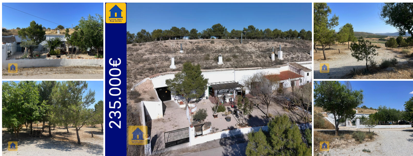
Cueva Pícolo en Venta Micena (Orce)

Cueva Pícolo es una impresionante casa cueva adosada construida en 1820. La casa cueva fue modernizada recientemente por su actual propietario, quien ha prestado una atención excepcional al diseño y al detalle. La propiedad se encuentra en un tranquilo camino rural en Venta Micena, una aldea rural en el encantador pueblo tradicional de Orce.