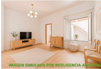
IMAGEN SIMULADA POR INTELIGENCIA ARTIFICIAL