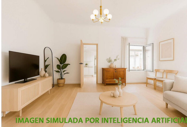
IMAGEN SIMULADA POR INTELIGENCIA ARTIFICIAL