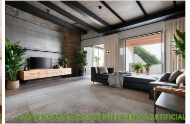
IMAGEN SIMULADA POR INTELIGENCIA ARTIFICIAL