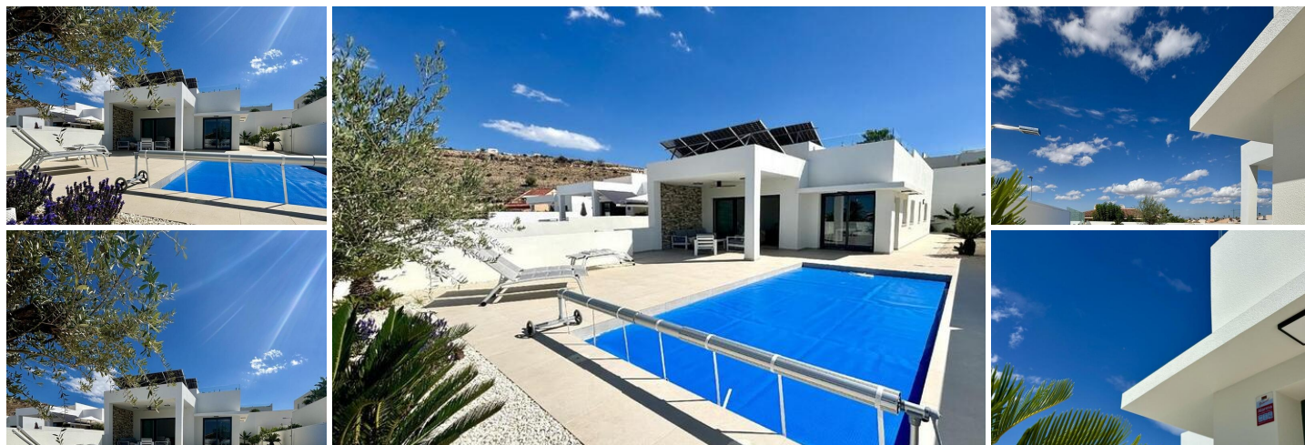
Villas de nueva construcción en Benijófar